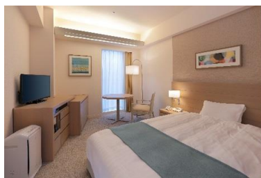
レディースシングル