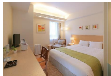
レディースエグゼクティブシングル

ご予約・お問合せ : 小田急ホテルセンチュリー相模大野 宿泊予約 Phone : 042-767-1111 / Fax : 042-767-1012