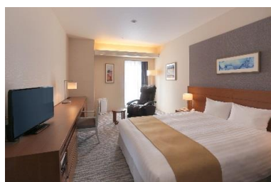
エグゼクティブシングル